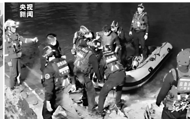
今年2月,在广西百色,国内首例洞穴潜水救援成功案例的示意图和救援成功的画面