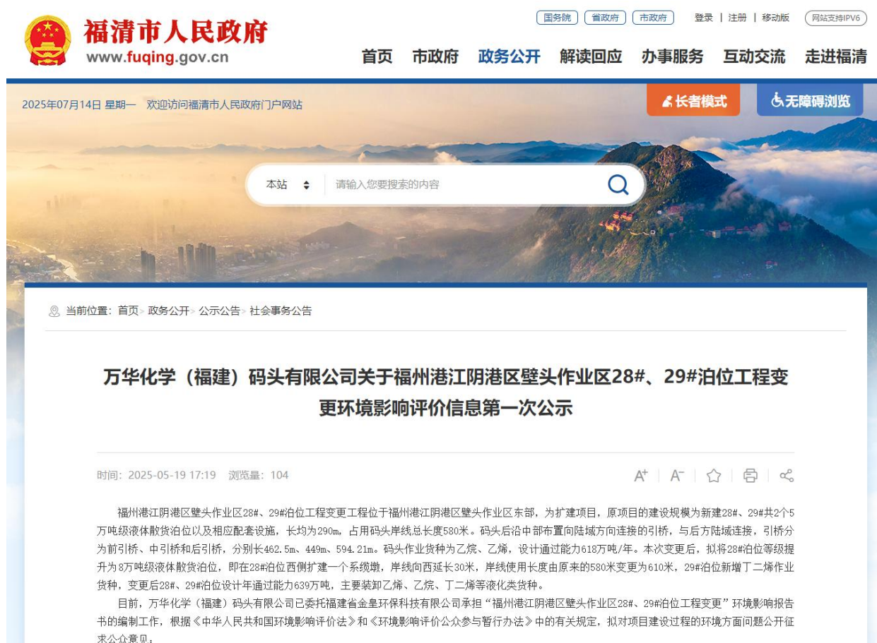
图 2.2-1 第一次网络公示截图

我公司在正式委托评价单位开展项目环评工作，即于 2025 年 5 月 19 日在福清市人民政府官网（ http://www.fuqing.gov.cn/ ）进行了第一次网络公示。第一次网络公示截图见图 2.2-1。