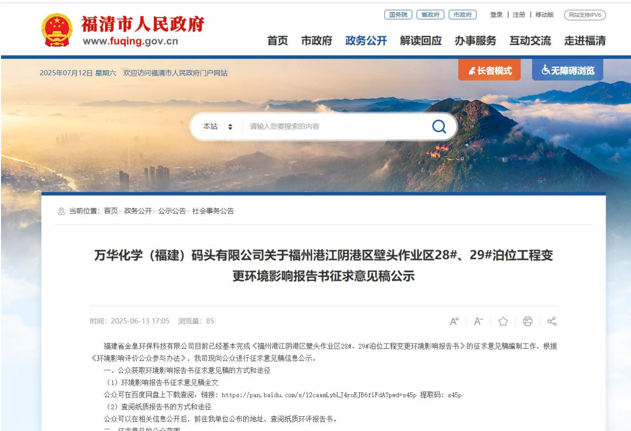
图 3.2-1 征求意见稿网络公示截图

项目环评报告书征求意见稿编制完成后，我在福清市人民政府官网进行了征求意见稿网络公示。征求意见稿网络公示截图见图 3.2-1。